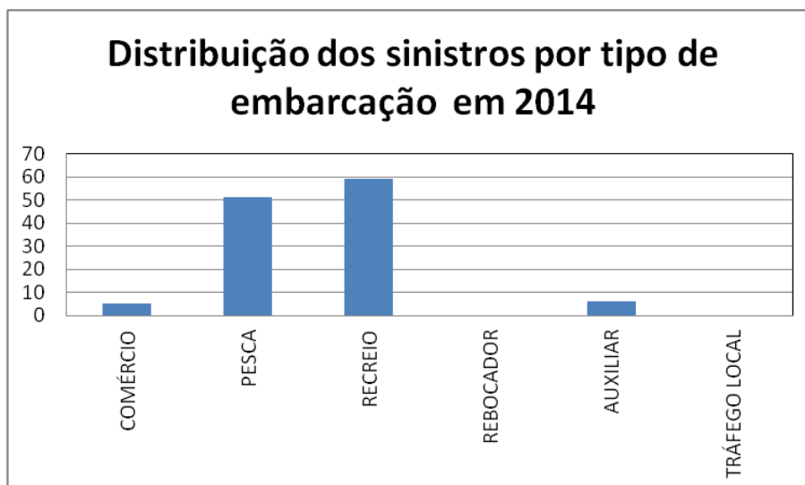
Quadro 7.3 - Distribuição dos sinistros por tipo de embarcação em 2014

Dos dois gráficos acima é possível concluir que o maior número de sinistros se verifica no segmento de embarcações de recreio, cuja prática é intensificada na época balnear, sendo, no entanto, de gravidade reduzida.